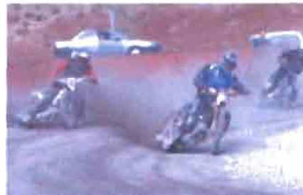
PÅ VEI TILBAKE: Speedwaymiljøet i Kristiansand håper på en ny storhetstid etter å ha ligget brakk i flere år. Nå står unge førere klare til å overta og følge opp NMK-suksessen på 1960 og 70-tallet. Her fra trening i Sørlandsparken sist lørdag.